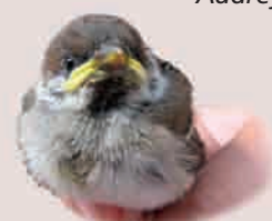
Moineau domestique juvénile