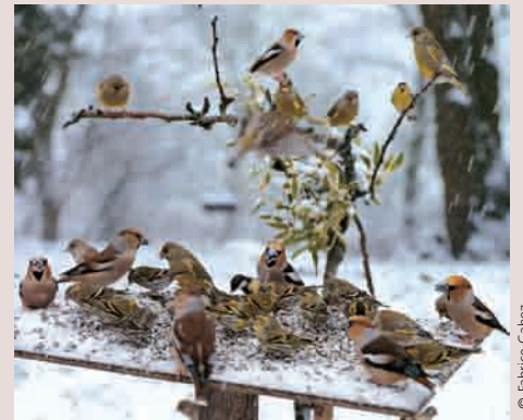
Grosbecs casse-noyaux, Tarins des aulnes, Verdiers d'Europe et Mésange charbonnière.

plantes sauvages en somme...) d'espèces indigènes et conserver les arbres morts riches en insectes. Ils raviront les petits becs une grande partie de l'année !