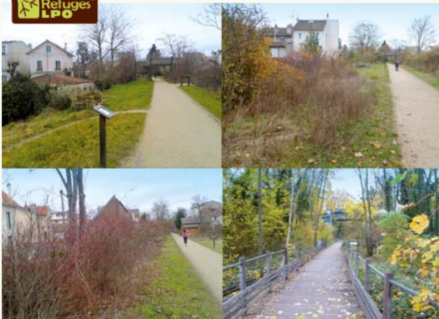
Dynamique de la végétation sur la coulée verte de Colombes

rattachée à la rive et est devenue le Refuge Pierre Lagravère. Par ailleurs, la ZAC écologique de l'île Marante sera aménagée afin de symboliser cet écosystème disparu et deviendra un autre Refuge. Dans le jardin de cette ZAC, on pourra y découvrir tous les thèmes écologiques liés à l'eau grâce aux milieux humides recréés, à la Seine et au site de potabilisation de l'eau tout proche. La ville de Colombes possède des parcs gérés par le service espaces verts et des milieux naturels gérés par le service d'écologie urbaine.