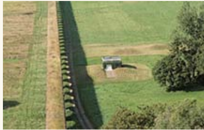
Champs captant Montreuil

Dans ce cadre, Eau de Paris s'est rapprochée de la LPO Île-de-France en 2014 dans le but d'intégrer le programme Refuges LPO Collectivités.