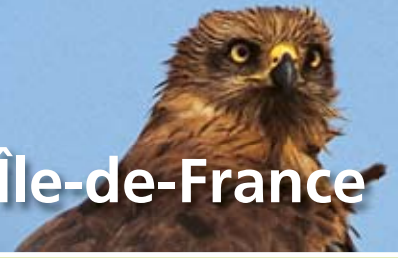
Milan noir

Bulletin de liaison destiné aux membres de la LPO