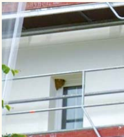
Nid d'hirondelle sur façade