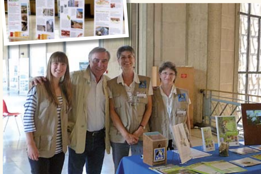
Stand et exposition au moment de la visite d'Allain Bougrain Dubourg