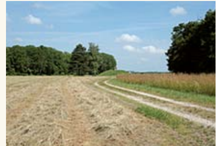
Champs captant des Vals d'Yonne