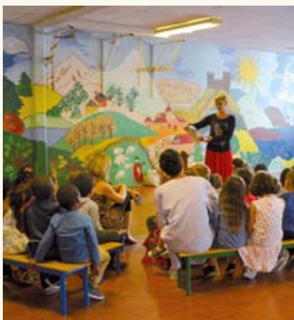
Animation maternelle de Thiais

À la création de notre groupe local, n'ayant des contacts qu'avec la ville de Vitry, nous avons décidé de nous faire connaître auprès des autres communes du Val-de-Marne. En avril nous avons donc adressé une lettre au maire de chaque commune où nous avions au moins un bénévole, pour présenter notre groupe et nos actions. Sur sept lettres envoyées, seule la mairie de Thiais nous a répondu et proposé une rencontre. Notre proposition de faire des animations dans les écoles de la ville les ayant beaucoup intéressés, trois membres du groupe ont donc présenté la vie des oiseaux communs au cours de deux matinées dans les écoles maternelles de la ville.