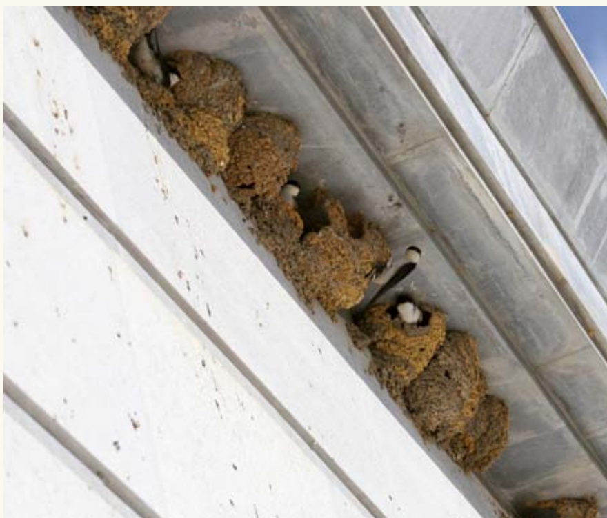
Hirondelles de fenêtre