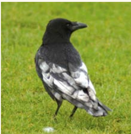
Corneille noire présentant des dépigmentations dues à des carences en lysine

Le pain et ses dérivés (pain de mie, biscotte...) sont peu recommandés pour les oiseaux. Éclairage sur ses effets indésirables.