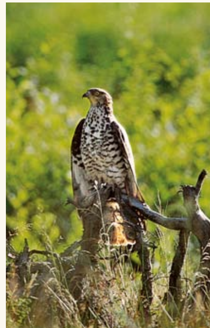
Bondrée apivore